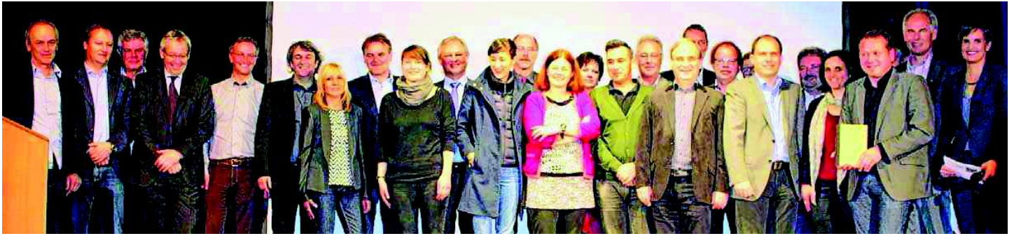
Ein Bild mit Symbolcharakter: Der Schulterschluss in der Region Walgau ist gelungen.