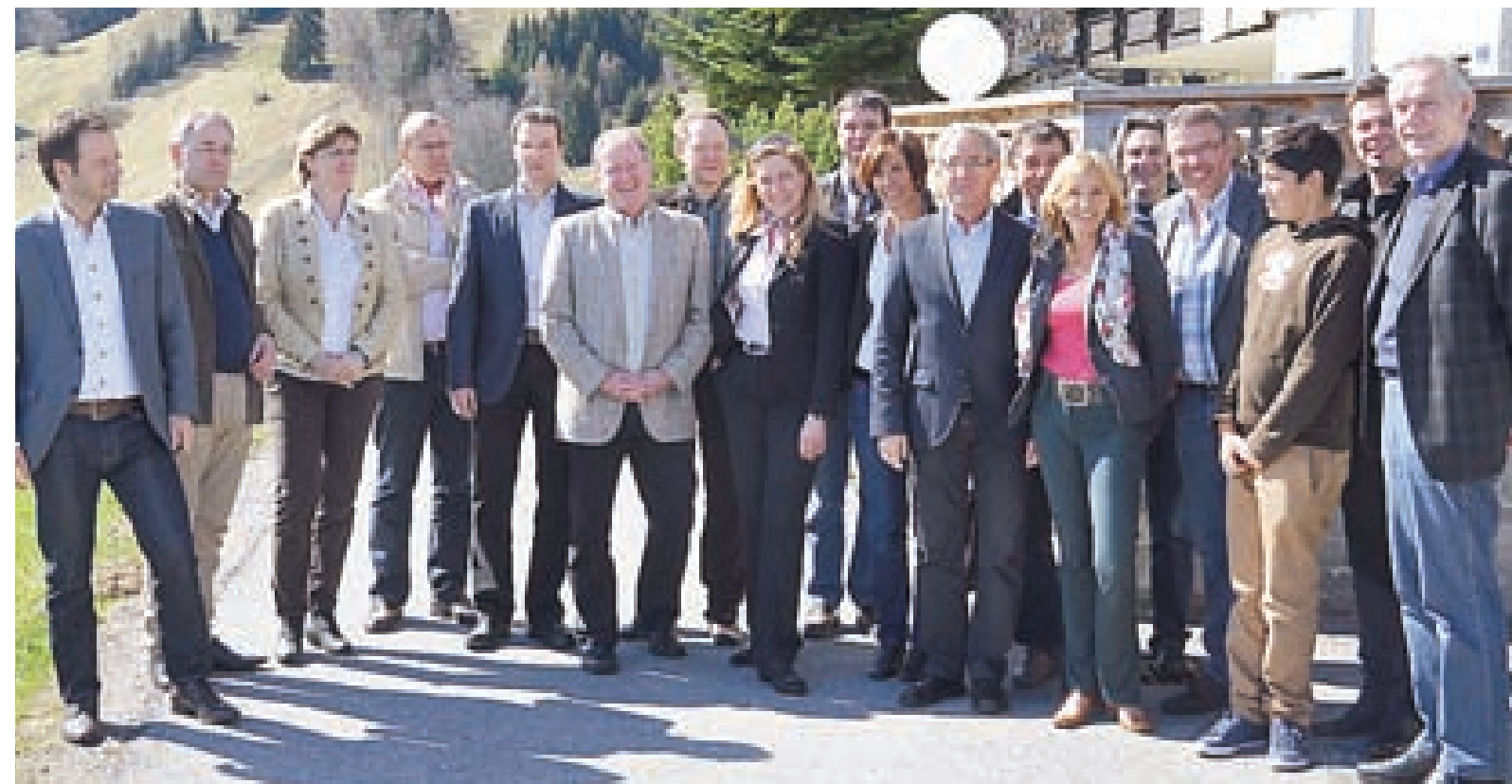
Wirtschaft im Walgau trifft auf Kärntner Wirtschafts-Experten