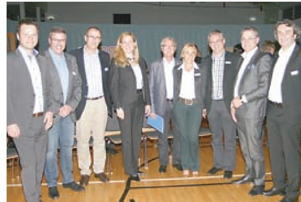
Auftaktveranstaltung in Schilns