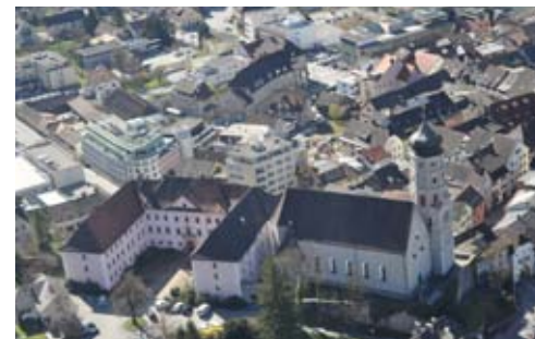
Im Altstadt kern architektonisch verwandt: Dachlandschaften