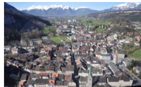
Beide Städte bieten 45.000 Menschen ein Dach über dem Kopf.