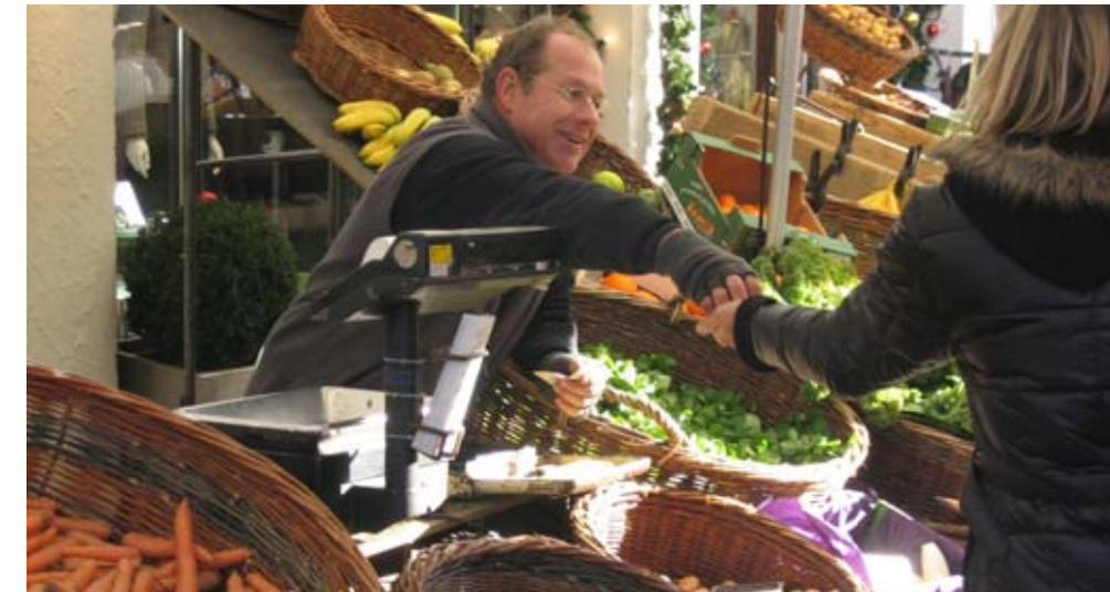
Von Hand zu Hand - Vertrauen in regionale Qualität.

... Ihre regionalen Produkte auf den Märkten in Bludenz und Feldkirch anzubieten? Dann melden Sie sich! Gerne möchten wir engagierte Kleinproduzenten zusammenbringen und Sie bei Ideen zur gemeinsamen Koordination unterstützen und zusammen überlegen, wie der Arbeitsaufwand möglichst klein gehalten werden kann. Kontakt: 05525 62215 151, sekretariat@imwalgau.at