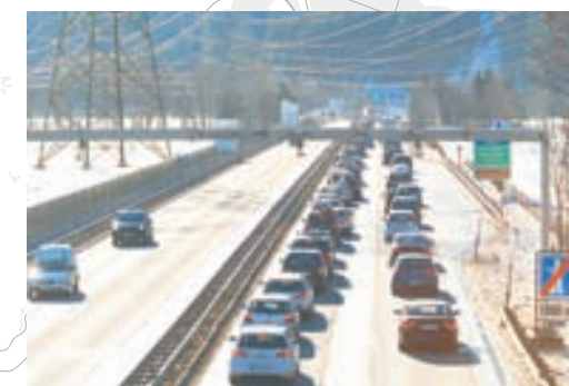
Stau in den Schiurlaub...