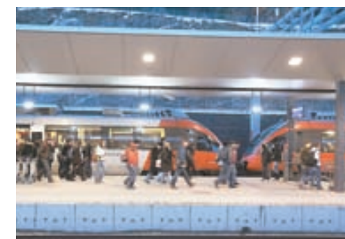
Am Bahnsteig Feldkirch

Neben kurzen und anschaulichen Präsentationen zu einzelnen Themen soll in kleinen Gruppen diskutiert werden. Die wichtigsten Ergebnisse werden sofort präsentiert und fließen in die weitere Bearbeitung der Ziele für die Regio Im Walgau ein.