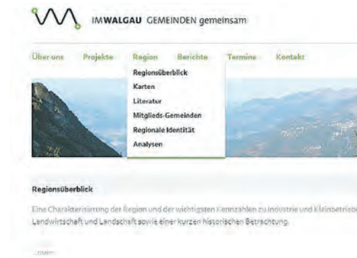
...und bietet Informationen rund um die Regio.