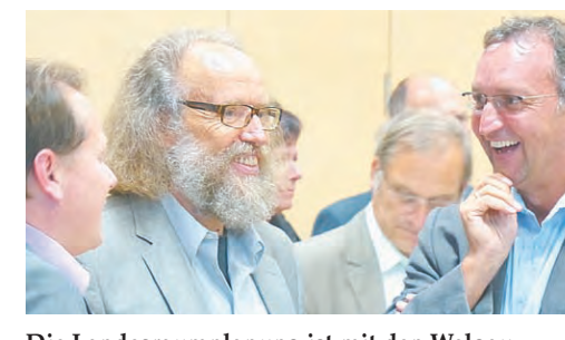
Die Landesraumplanung ist mit den Walgau-Gemeinden auf Augenhöhe.