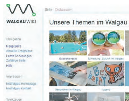
Das WalgauWiki ist ein mögliches Instrument,....