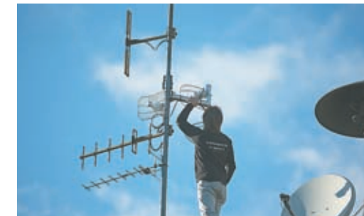
Flächige Internetversorgung der Walgauer Hanggemeinden

Im September 2013 wurde diese Studie abgeschlossen und gleichsam mit dem Aufbau einer Testanlage begonnen. Nach kurzer Bauzeit wurde am 15. Oktober die Testanlage in Betrieb genommen. Seit diesem Datum konnten bereits einige Teststellungen ausgeben werden, um die Verträglichkeit und Stabilität der Anlage unter realen Bedingungen zu prüfen. Die Tester sind sehr zufrieden, da es ihnen ihre Arbeit im Internet mit einer deutlich höheren Internetgeschwindigkeit sehr erleichtert. Die Anlage ist in der ersten Ausbaustufe für ca. 50 Teilnehmer ausgelegt. Es werden mit diesem Projekt Leistungswerte wie in Ballungszentren erreicht, denn unser Internet kennt keine „Höhenangst“. Es können weiterhin kostenfreie Teststellungen für den Zeitraum von einem Monat geordert werden.