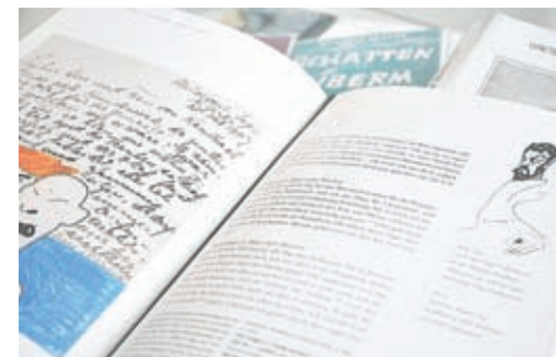
Schritt 3: Neuerscheinungen im Walgau