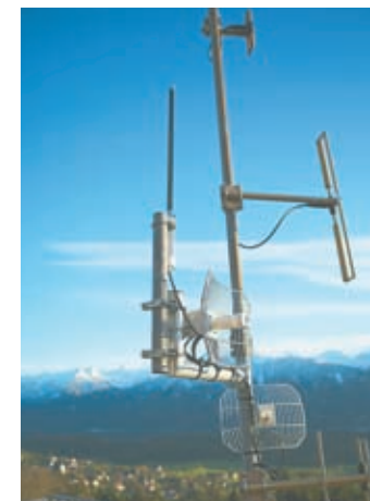
Stationen in Frastanz, am Hensler, Schnifner Ried und Düns.