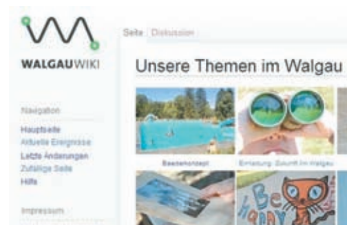
Schritt 1: www.wiki.imwalgau.at Startseite

Wikis sind öffentlich, unkompliziert und ständig in Veränderung. Das ist auch der entscheidende Unterschied zu einer Homepage . Ähnlich der „großen Schwester“ Wikipedia ist das WalgauWiki ein Online-Nachschlagewerk mit Walgau-Themen als Schwerpunkt. Aber in einem Wiki geht es um mehr: Teilen (von Wissen) und gemeinsames Arbeiten . Jeder, der einen Internetzugang besitzt, kann sich mit einer einfachen Registrierung anmelden (dauert nur einige wenige Minuten) und dann eine kurze Info oder einen ganzen Artikel beisteuern . Jede