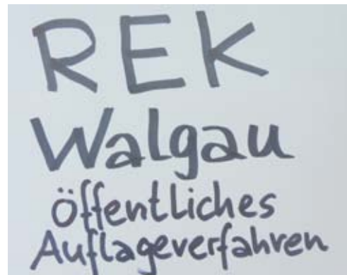
WalgauWiki -> REK Walgau-Auflageverfahren

Viele Burgen beziehungsweise Denkmäler im Walgau sind im WalgauWiki historisch beschrieben: mit Feldkirch und Bludenz sind dies beachtliche 26 Stätten. Noch wesentlich umfassender ist das Verzeichnis aller alten Kirchen und Kapellen - konkret 108 Orte der Besinnung sind nicht nur erwähnt, sondern großteils detailliert dargestellt. Dank zweier unermüdeten Wikiautoren können wir heute stolz auf dieses gesammelte Wissen verweisen. Alles nachzulesen unter http://wiki.imwalgau.at/wiki/Dossier:_Geschichte_im_Walgau