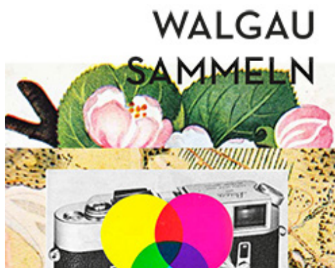
WalgauWiki -> Kulturgütersammlung Walgau

Das erste Walgaubuch (Im Walgau Gemeinden gemeinsam) wollte neugierig auf die Region machen: Es hat wichtige Themen umrissen, Projekte beschrieben und den Gründungsprozess der Regionalentwicklung dargestellt. Das zweite Walgaubuch soll nun unsere Ziele und Visionen zeigen. Die ‚gewünschte Entwicklung‘ des Walgau wird dort dann anschaulich in Form von Geschichten beschrieben. Die regionalen Leitsätze und Ziele werden mit Beispielen unterlegt. Das Buch soll auf die Zukunft neugierig machen und dazu beitragen, dass sich der Blick auf die Chancen und Gestaltungsmöglichkeiten richtet. Das Buch stellt den Walgau als moderne Region auf dem Weg in die Zukunft dar und wird 2015 erscheinen. Mehr dazu http://wiki.imwalgau.at/wiki/Unsere_Zukunft_im_Walgau