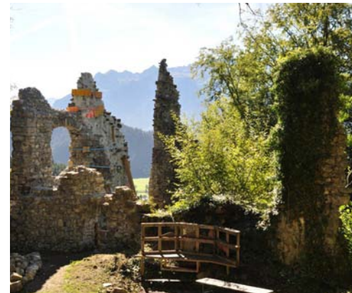
Die Burgruine Blumenegg wird zum Kulturraum mit Veranstaltungs-Pavillon

Das Projekt „Dreiklang IV – Freizeit-Infrastruktur“ möchte die Dreiklangregion Düns, Dünserberg und Schnifis weiter nachhaltig stärken. Die erfolgreiche Entwicklung der vergangenen Jahre führte in manchen Bereichen zu Engpässen, die es zu beseitigen gilt. Dies betrifft vor allem die Auslastung der Betriebe (Seilbahn, Gastronomie, etc.), die in Spitzenzeiten an ihre Grenzen stößt, in Randzeiten jedoch gesteigert werden könnte. Zur Belegung der Randzeiten sollen spezielle Angebote entwickelt werden. Im Verkehrsbezug werden Maßnahmen zur Verbesserung des Umweltverbunds geplant, die Grundlagen für eine Parkplatzlenkung und -bewirtschaftung werden ausgearbeitet. Ein ebenfalls wichtiges Thema ist das mangelnde gastronomische Angebot in Schnifis sowie das Bürgerhaus Düns mit seinem für die Region wichtigen Raumkonzept. Diesem umfangreichen Themenkomplex wird sich das Projekt die kommenden drei Jahre widmen um die Lebensqualität in der Dreiklangregion zu steigern. http://www.region-dreiklang.at/