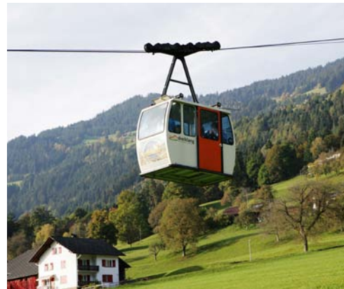
Verbesserungen rund um die Schnifner Seilbahn sind geplant

Spenden und Getränkeinnahmen (500 Euro) gingen an AsylwerberInnen. http://www.kultur10vorne.at/