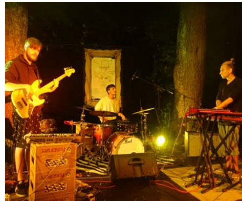
Vier Bands begeisterten die Zuhörer beim Gartenfest in Frastanz