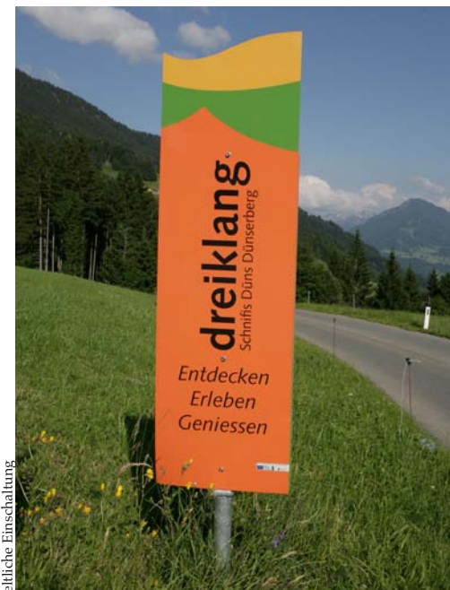
Die Dreiklangregion macht sich stark