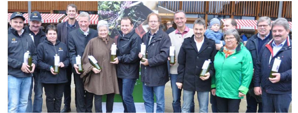
Premiere: Der Apfelsaft aus Walgauer Streuobst wird beim Fest erstmals ausgeschenkt. Der „Walgausaft“ ist beim Bovelhof Mähr in Düns in 1-Liter-Glasflaschen erhältlich.

Das „erste Walgauer Apfel- und Kartoffelfest“ war trotz schlechtem Wetter gut besucht. Unter dem gläsernen Vordach sowie im Foyer des Gemeindezentrums Ludesch luden insgesamt 20 Stände zum Probieren, Kaufen und Lernen ein. Von Raclette mit heißen Kartoffeln über Kartoffelsuppe bis hin zu Apfelmuffins war für das leibliche Wohl bestens gesorgt.